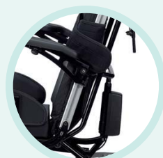
Dossier ajustable électriquement