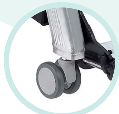
Petites roues avant permettant de se déplacer