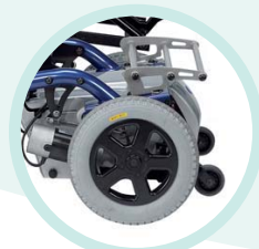
Roues arrière bandage en option