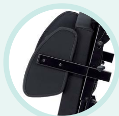
Protège vêtements amovibles