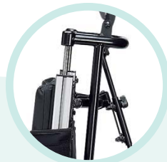
Dossier coulissant pour garder une bonne posture lors de la verticalisation