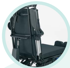
Accoudoirs relevables pour les transferts