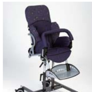
Châssis d'intérieur avec assise multifonctionnelle