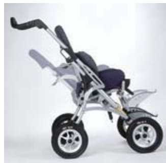
Inclinaison de l'assise, du dossier et des repose-pieds