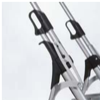
Mécanisme de pliage