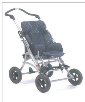
Kimba Spring taille 1 Roues avant fixes