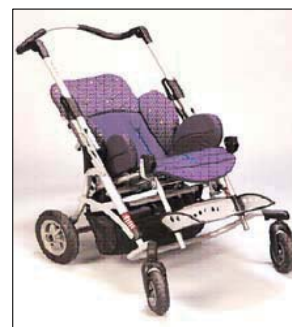
Kimba Spring taille 2 Roues avant pivotantes