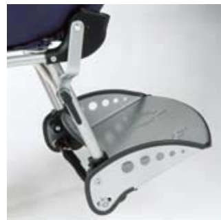
Repose-pieds rabattable avec réglage angulaire