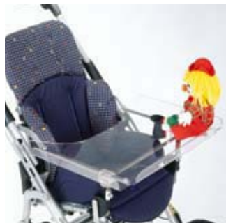
Tablette thérapeutique transparente