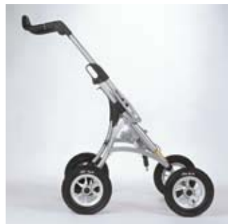
Châssis d'extérieur, rigide