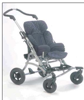
Kimba Spring taille 1 Roues avant pivotantes