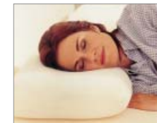
OREILLER TEMPUR CLASSIC