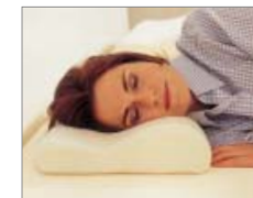
OREILLER TEMPUR ORIGINAL

Les propriétés supérieures d'allègement de la pression ainsi que la forme anatomiquement correcte des oreillers assurent un soutien adapté aux vertèbres cervicales.