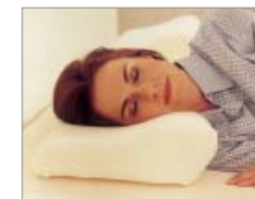
OREILLER TEMPUR MILLENNIUM