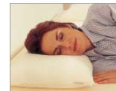
OREILLER TEMPUR COMFORTPILLOW